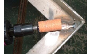
ビトリファイド軸付砥石