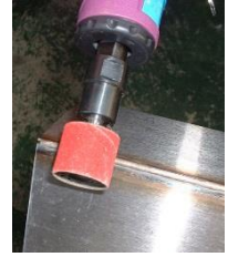
ユニバンド・セラミック