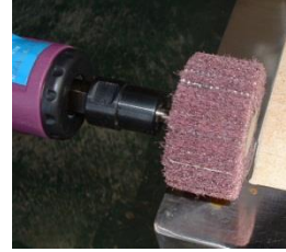
ユニロン軸付ホイール