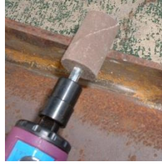
軸付カートリッジロール ストレート型