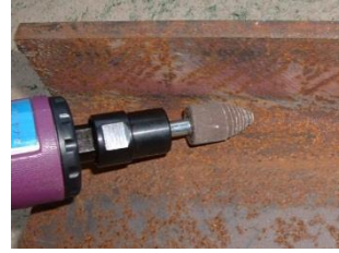
軸付カートリッジロール テーパー型