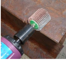
ムゲン軸付フラップ